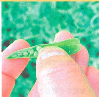
②実の中のタネを出します。