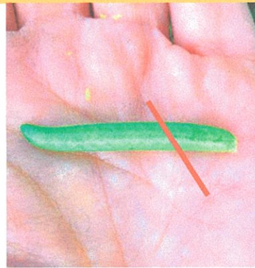
④実のツルについていた方から1/3を切り取ります。