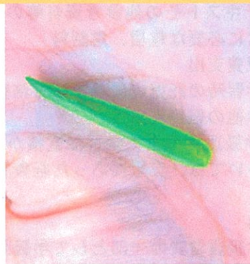
③実の中をツメでそうじしてツルツルにします。